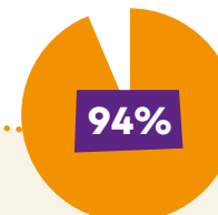
Bosnja dhe Hercegovina